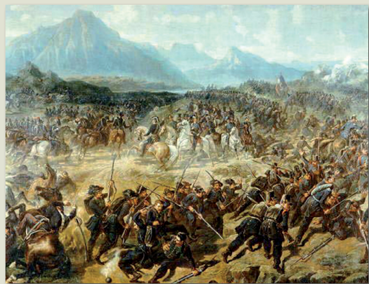
La carica dei Carabinieri Reali a Pastrengo

Il territorio veronese ha vissuto con le sue popolazioni l'intero corso delle tre guerre risorgimentali che negli anni hanno portato all'unità d'Italia, e crediamo che la maniera più efficace per mantenere viva la memoria storica di quegli irripetibili eventi, sia di trasmetterla ai nostri giovani nella certezza che la comprensione del proprio passato aiuti a migliorare il futuro.