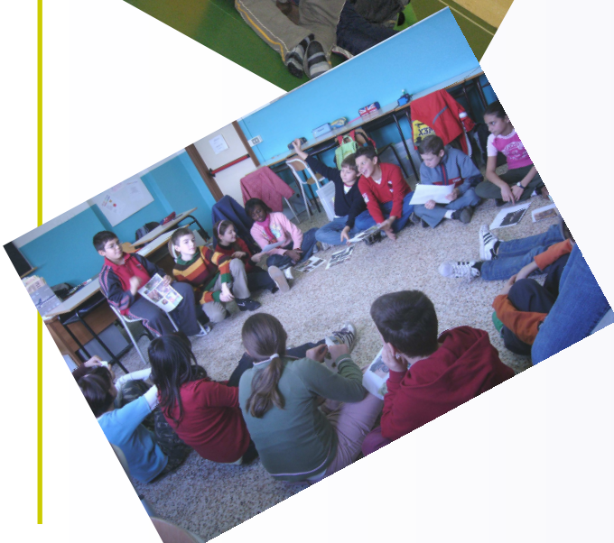
Progetto sulla legalità realizzato presso le scuole medie di Mozzecane nell'ambito dell'iniziativa UNICEF 2008