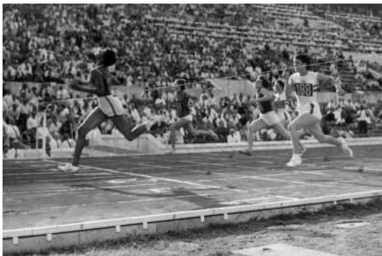
La Rudolph vince i 100 m a Roma

Wilma fu la mattatrice delle Olimpiadi romane: oro nei 100 m, nei 200 m e nella staffetta 4×100 m, tre vittorie capaci di offuscare il mitico trionfo dell'italiano Livio Berruti (primo non nordamericano a conquistare l'oro nei 200 metri), l'esaltante maratona a piedi nudi dell'etiope Abebe Bikila e il successo sul ring (oro annunciato) del futuro Muhammad Ali, Cassius Clay.