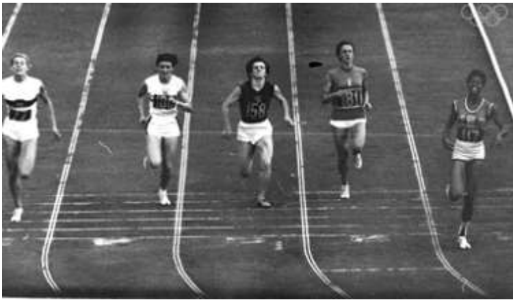
la vittoria di Wilma sui 200 m a Roma

creano un mito» fu scritto sul Corriere della Sera del 9 settembre 1960. «Il mito fiorito in questa edizione dei Giochi porta il nome di una ragazza nera di vent'anni, un'americana degli Stati Uniti: Wilma Rudolph. È giovane, bella, orgogliosa. È la donna più veloce del mondo».