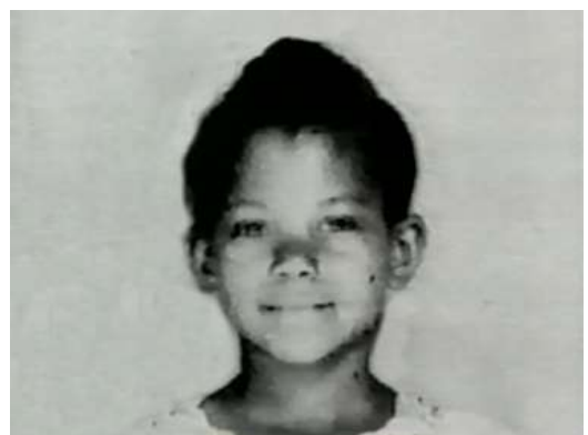
Una giovanissima Wilma

Wilma Glodean Rudolph venne alla luce prematuramente il 23 giugno 1940 a St. Bethlehem, a nord est di Clarksville, nello stato del Tennessee. Pesava 2 kg, ed era la ventesima di quelli che saranno i ventidue figli del padre Ed, sesta degli otto figli della madre Blanche. Ed lavorava in ferrovia come fattorino e Blanche come domestica in una casa di bianchi della città, mentre Wilma cresceva in una casa di legno in quella parte cittadina riservata alle residenze dei neri. I figli più grandi badavano ai più piccoli, la madre cuciva alle ragazze vestiti fatti con i sacchi di farina, i fratelli andavano a lavorare presto. Wilma si ammalava spesso: morbillo, scarlattina, tosse, polmonite e, nel 1944, a quattro anni, le fu diagnosticata la poliomielite, conosciuta negli anni Quaranta come una delle malattie più paralizzanti.