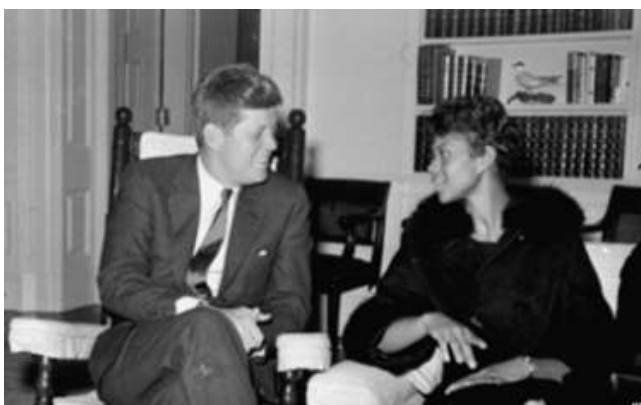
la Rudolph ricevuta da John Kennedy

A cinquantquattro anni, la sfida finale, un'altra prova in cui non conta il sesso, la razza o la religione: un tumore al cervello. Lo sprint di Wilma non è bastato. Dopo il suo ritiro dalle gare nel 1963 si era dedicata all'insegnamento e attraverso l'opera della fondazione che porta il suo nome continua tutt'oggi ad aiutare i bambini in difficoltà. «Il premio non è mai così grande se manca la lotta per ottenerlo» era il suo motto per i bambini. Una frase tra le tante citazioni che sono raccolte nella sua autobiografia: «Non so perché corressi così forte. Pensavo solo a correre».